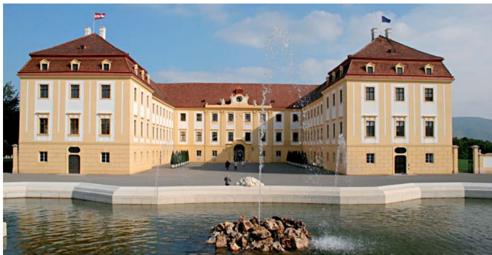
Schlosshof - svojho času honosné a rušné sídlo, obľúbené miesto pobytu Márie Terézie. Za jej čias zámok prestavali v duchu francúzskeho klasicizmu, rozšírili a upravili do dnešnej podoby. Kontrapunktom k architektonicky striedmemu čestnému nádvoriu je monumentálna fontána v predpoli paláca. Priečelia paláca sú kompozične nenáročné, pokojné, no elegantné