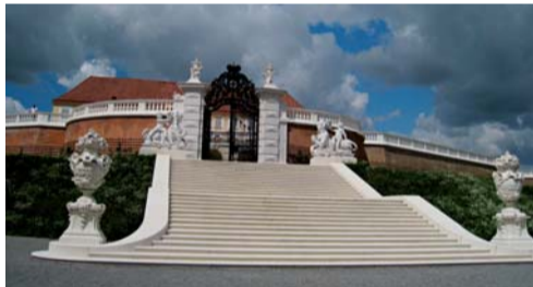
Podľa historických dokumentov boli zrekonštruované pôdorysné tvary výsadbových polí, ich botanická skladba i tvarovo-priestorová kompozícia. Dlhú líniu kompozičnej osi oživujú terasové zlomy s bránami a odlišná biologická skladba výsadby

Aj keď bol Meierhof služobným zázemím zámku, jeho kompozícia (pôdorys v tvare písmena E - snád symbol princa Eugena?) bola rozvrhnutá do funkčne oddelených zón tak, aby sa minimalizovali nepríjemné prejavy prevádzky. I on