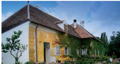
V kontaktnéj zóne, najbližšie k zámku, bolo umiestnené sadyovníctvo, vrátane malej okrasnej záhrady s fontánou a sklenikom (oranžériou), ďalej vo dvore kuchynská prevádzka aj s bylinkovou záhradkou