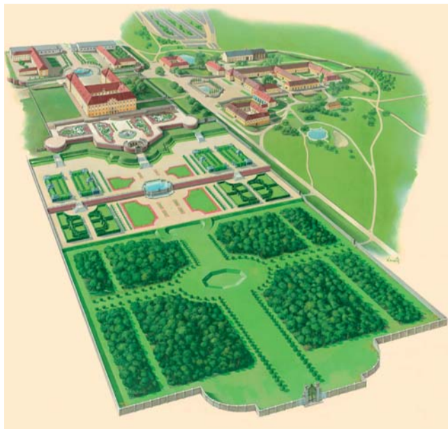
Prehľadná situácia celého areálu